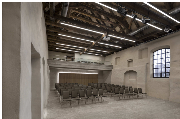
Veranstaltungsraum im ehemaligen Kloster