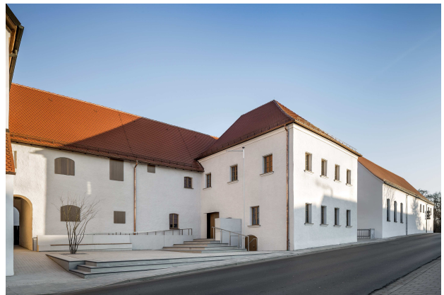
ehemaliges Kapuzinerkloster u. Klosterbrauerei, Neumarkt i. d. OPf.

Berschneider + Berschneider betreut seine Auftraggeber vom ersten Entwurfsgedanken bis zum Einzug und bearbeitet alle Leistungsphasen. Darüber hinaus deckt das Büro mit der Software der Münchener G&W Software AG die gesamte Kostenplanung und -kontrolle seiner Bauvorhaben ab.