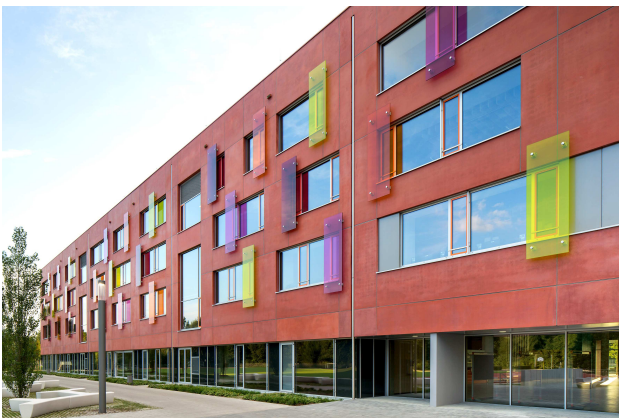
Rot durchgefärbter Sichtbeton ist Markenzeichen des Willibald-Gluck-Gymnasiums, Neumarkt i.d. OPf.